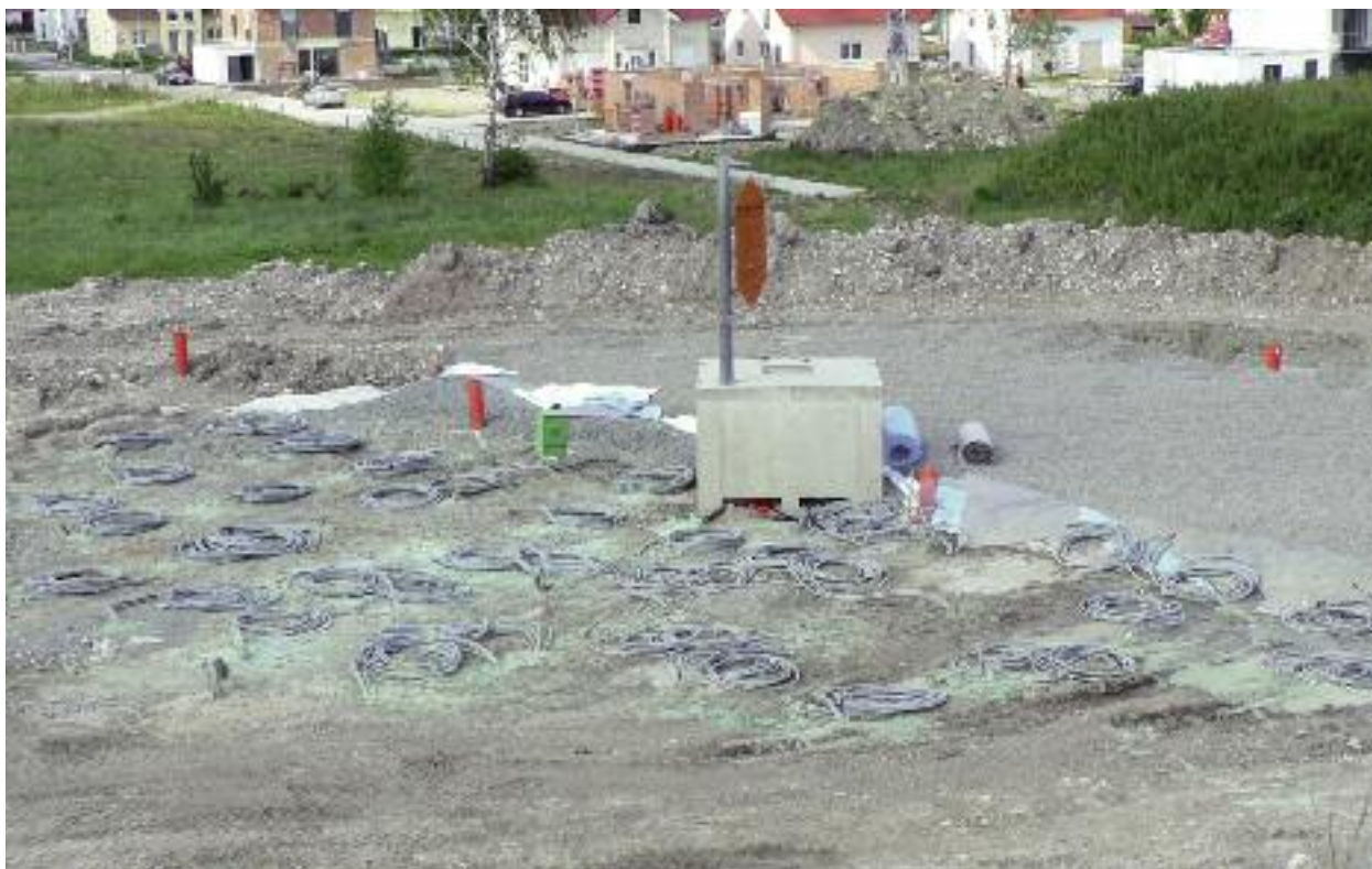
Bau eines Erdsondenwärmespeichers